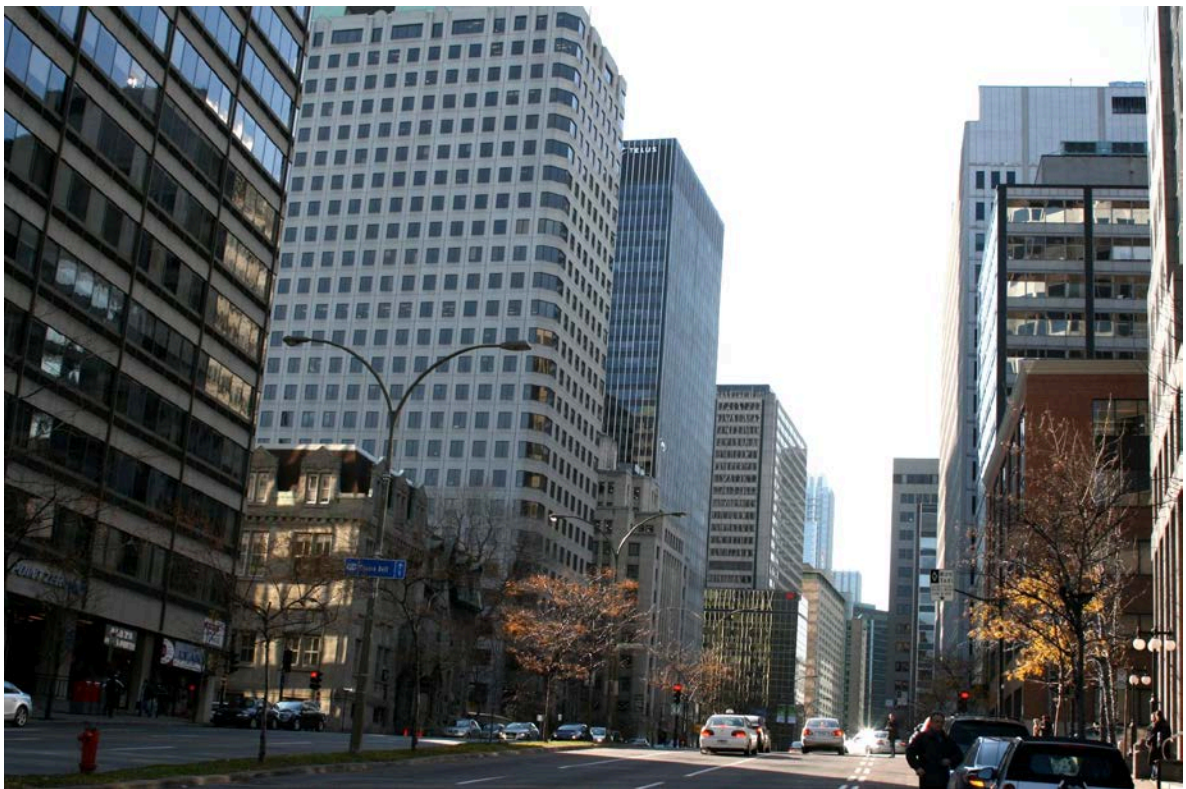
Le Boulevard René-Lévesque, axe des affaires à Montréal.

Il ne faut pas sous-estimer les différences - par rapport à l'Europe - de comportement au bureau, les relations entre collègues, les relations avec la hiérarchie. Il est donc très utile de suivre des conférences ou un training sur les différences culturelles.