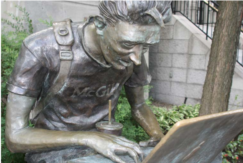
Un étudiant et son laptop, sculpture devant le portail de McGill sur Sherbrooke.

Les étudiants étrangers dont le Permis d'Études a été délivré après le 1 er juin 2014 et qui sont inscrits à temps plein dans des écoles agrées (toutes les Universités et CEGEPs sont agrées) :