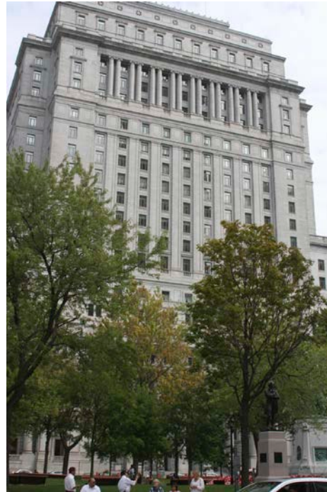
L'immeuble Sun Life, place Dorchester, a longtemps été le plus haut bâtiment de l'Empire britannique.